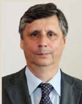
Ing. Jan Fischer, CSc. předseda vlády České republiky, předseda Českého statistického úřadu