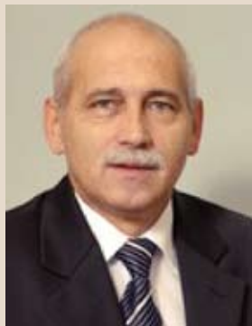
RNDr. Příklad Vít náměstek hejtmána pro resort hospodářského a regionálního rozvoje, evropských projektů a rozvoje venkova